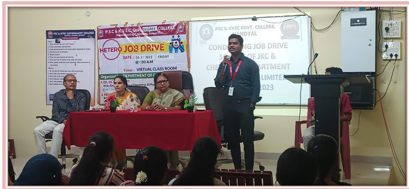
Pre- talk about the company by HR people of the” Hetero” company